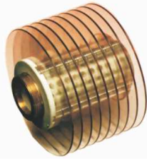
Conjunto de disco Ø150mm, espessura 1mm, para esmaltação, M49 Cód. 070001001