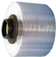
Conjunto de disco com 32 lâminas Ø 150x1mm, para esmaltação, M49 Cód. 070001001