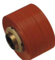
Conjunto de disco Ø150mm tipo "HARD PUR" p/ esmaltação M49, 1mm Cód. 070044002