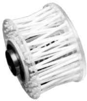
Conjunto de disco flange Ø150mm Cód. 070045001 - Disco fracionado, esmaltação barras cerâmicas inclinadas, gotas grandes e irregulares.