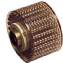
Conjunto de disco com flange Ø 150mm Cód. 070028001 - Disco mola inox gotas médias e regulares.