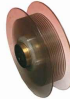
Conjunto de disco com flange Ø 200mm, para esmaltação, M49, 1mm Cód. 070011001