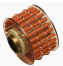
Conjunto de disco com flange Ø 150mm, barrete "HARD PUR" p/ esmaltação M49, 1mm Cód. 070042001