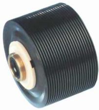
Conjunto de disco Ø 150mm, M49, 1mm Cód. 070076001