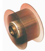
Conjunto de disco com flange Ø 200mm, para esmaltação, M49, 1mm Cód. 070005001