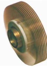
Conjunto de disco Ø 150mm para esmaltação M49, 1mm Cód. 070008001