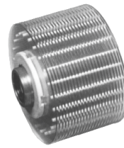
Conjunto de disco Ø150mm Cód. 070013002 - Disco barras cerâmicas gotas pequenas e regulares.