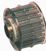
Conjunto de disco com flange Ø 170mm e mola em aço inox para esmaltação M49, 1mm Cód. 070022001