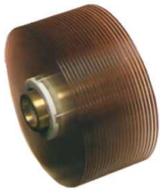
Conjunto de disco Ø 170mm, para esmaltação M49, 1mm Cód. 070004001