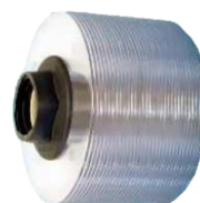
Conjunto de disco com 24 lâminas Ø150x2mm, para esmaltação, M49 Cód. 070001002