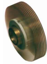
Conjunto de disco Ø 150mm, para esmaltação M49, 1mm Cód. 070009001