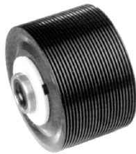
Conjunto de disco Ø150mm Cód. 070076005 - Disco fracionado, esmaltação e gotas médias e regulares.