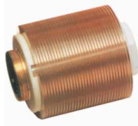
Conjunto de disco Ø 89mm, para esmaltação M49, 1mm Cód. 070019001