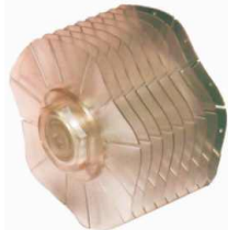
Conjunto de disco Ø170mm ondulado, espessura 1mm para esmaltação, M49 Cód. 070003001