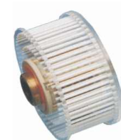
Disco com flange Ø170mm M49, 1mm. Cód. 070046001 Disco barras cerâmicas, gotas grandes